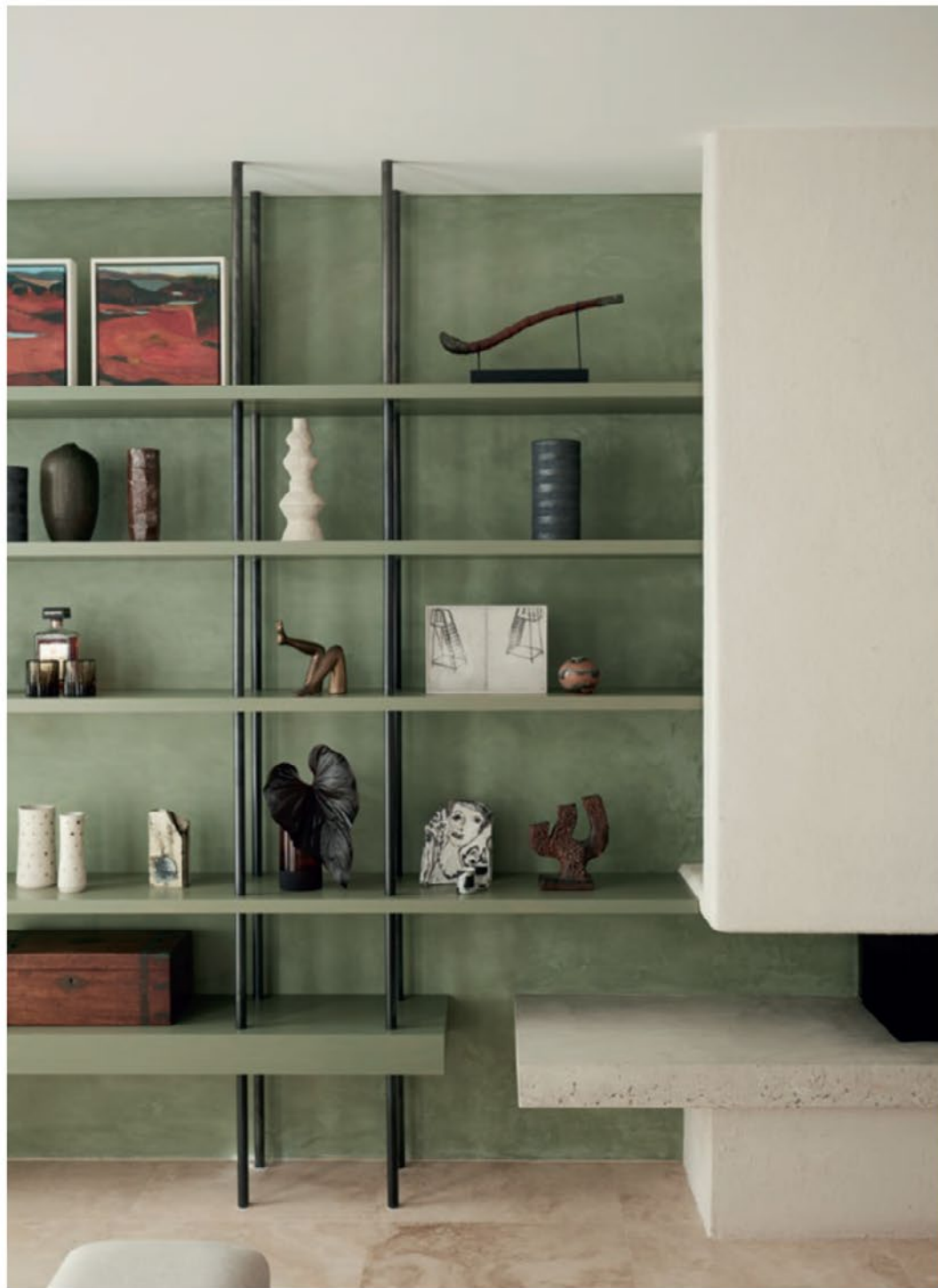
© Balbek Bureau, photography by Peter Rindler

Met veertien jaar ervaring in residentiële, zakelijke en commerciële ruimtes was het voor Balbek Bureau een evidentie om vroeg of laat een project neer te zetten waarin groen een van de errollen mocht opstrijken. Mama Manana is een restaurant in Kiev waar gastvrijheid de belangrijkste waarde is. Het nieuwe interieur moest dat verhaal vertellen vanaf de eerste seconden dat klanten het pand binnenstappen. Hier zie je hoe groene muurtegels een onderscheidend effect oproepen. Bezoekers voelen zich op hun gemak en genieten tegelijkertijd van een uitstekende service, en dat in een omkadering van een uitgesproken kleur.