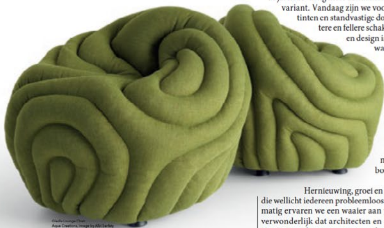
Studio Lounge Chair Aqua Creations, image by ASL Design

Hernieuwing, groei en veiligheid zijn allemaal begrippen die wellicht iedereen probleemloos met de kleur associeert. Gevoelsmatig ervaren we een waaiertje aan positieve emoties, dus is het niet verwonderlijk dat architecten en ontwerpers uitgebreid aandacht aan groene elementen zijn gaan besteden. En de mogelijkheden zijn