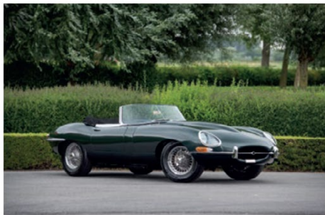
© The Car Club, Jaguar is Jaguar, foto's: (licht) voor de CH de Jaguar