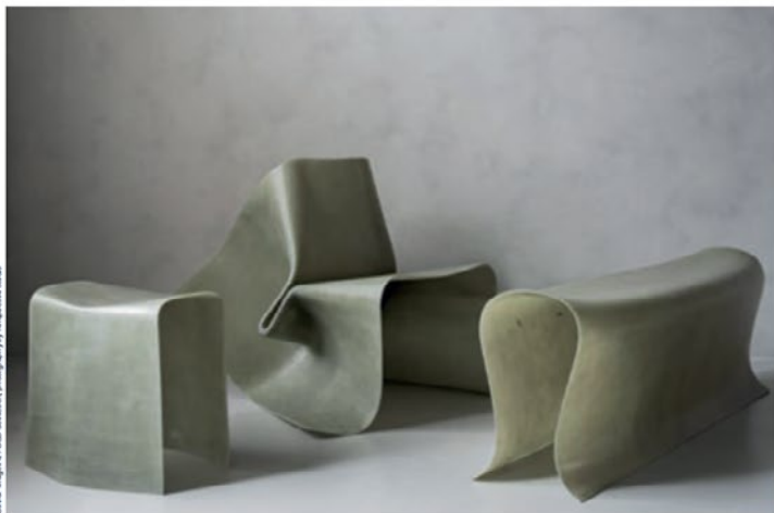
© Olivier Grégoire / YSG Studio, ontwerp voor Inspecies.be