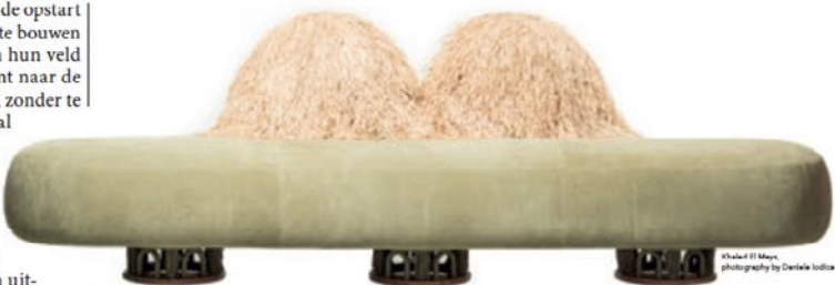
© Richard H. Moore, photography by Daniela Iodice

studio in interieurontwerp. Sinds de opstart in 1984 zijn ze erin geslaagd mee te bouwen aan nieuwe standaarden binnen hun veld van expertise. Hun portfolio hint naar de Braziliaanse cultuur en tradities, zonder te vermijden dat de collecties overal ter wereld op weerklank mogen rekenen. Meerdere ontwerpen van hun naam maken deel uit van de permanente collecties van gerenommeerde culturele instellingen. De vele jaren aan ervaring laten toe dat ze van een uitmuntende reputatie genieten. De Bolotas Armchair is zoals de ontwerpers zelf: ex-